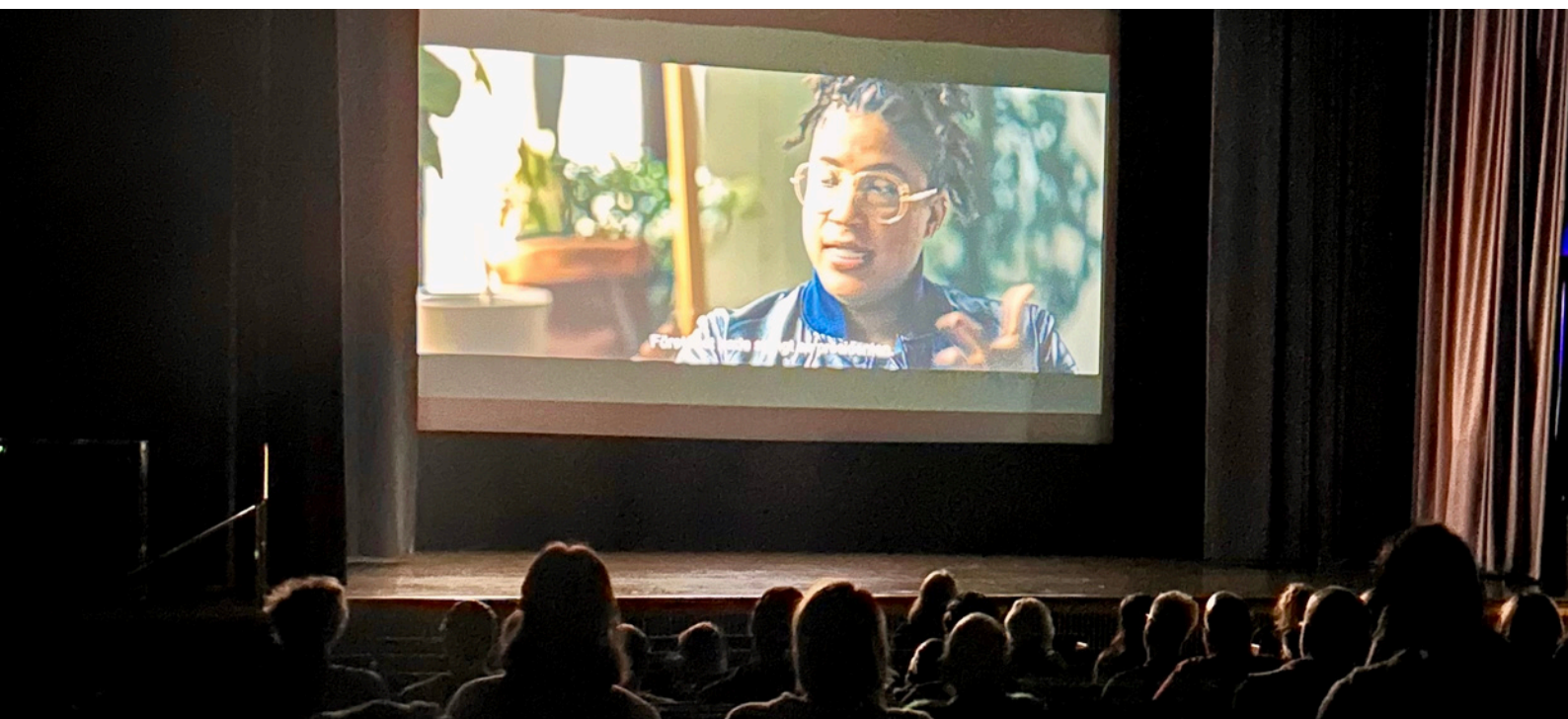
Bild: Filmvisning Hacking Hate, januari 2025

Neddragningen av statsbidrag som för 2025 innebar nettobidragsminskning på 1,9 MSEK jämfört med 2024, fick kännbara förändringar för verksamheten i samarbeten med föreningar och fria grupper, föreläsungsverksamheten och kursverksamheten.